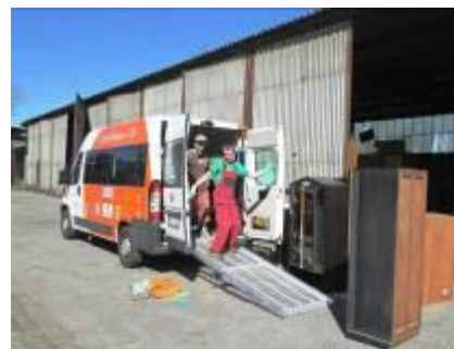
Nábytek a kompenzační pomůcky od Nadace Dobré dílo sester sv. Karla Boromejského