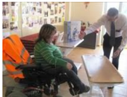
Kompenzační pomůcky od Církve Ježíše Krista Svatých posledních dnů