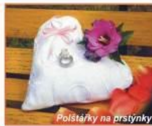
Poštárky na prstýnky