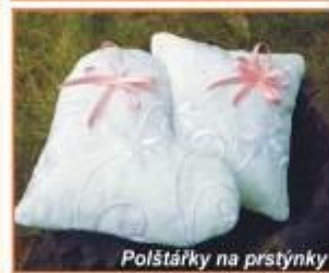
Poštárky na prstýnky