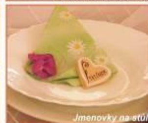
Jmenovky na stůl