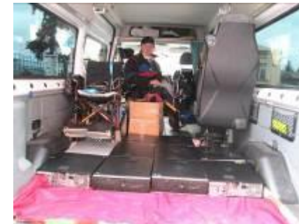
Počítače od Nadace Charty 77