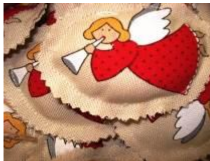
Dary látek pro výrobu v textilní chráněné dílně od společnosti Darré - Hradec Králové.

Děkujeme Vám, že pomáháte společně s námi!