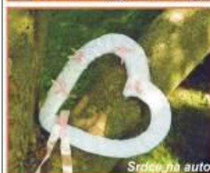
Srdce na auto