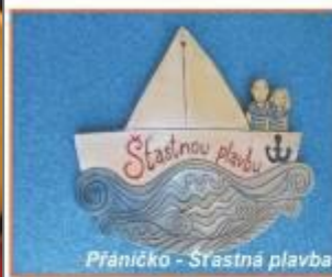
Přáníčko - Šťastná plavba