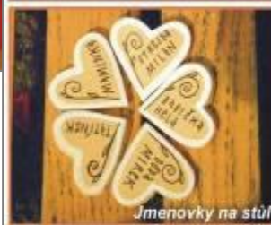
Jmenovky na stůl