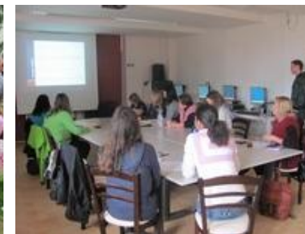
Fond pomoci společnosti Siemens – nový web