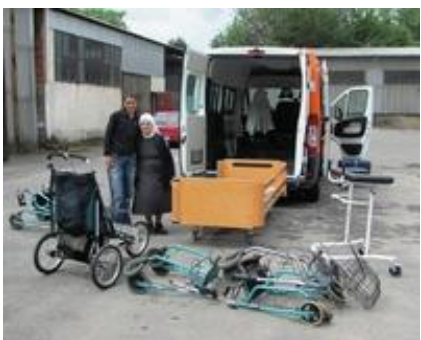
Nadace Dobré dílo sester sv. Karla Boromejského, Praha