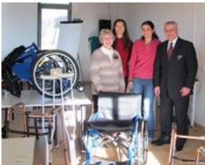
Církev Ježíše Krista Svatých posledních dnů