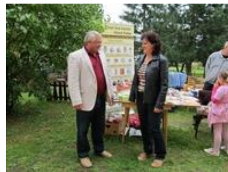
Setkání s vícehejtmanem KHKÚ

Setkání v Praze se zástupci Nadace Komerční banky Jistota a předání šeku na nákup polohovací postele.