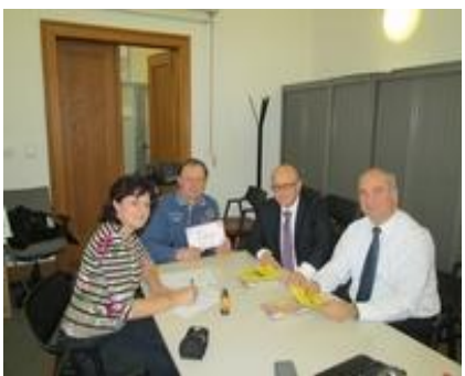
Nadace Komerční banky Jistota