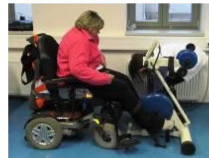
Nový motomed od Nadace Jistota KB