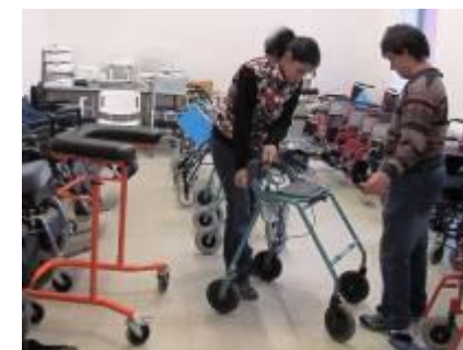
Kompenzační pomůcky díky Nadaci Dobré dílo sester sv. Karla Boromejského a Výboru dobré vůle – Nadaci Olgy Havlové