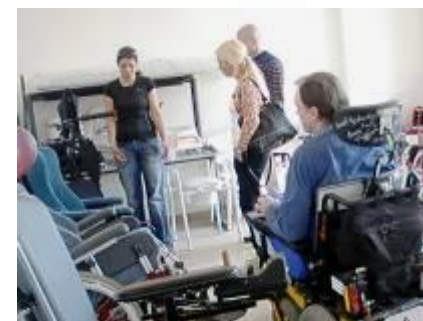
Nadační fond Pomoci