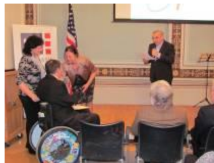
Grant od Nadace Občanského fóra