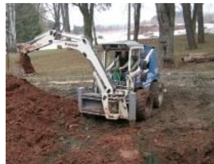
Príspevek na bezbariérový bagr od Nadace Divoké husy