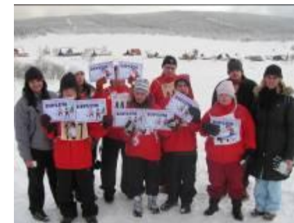
Účast na zimních hrách Speciálních olympiád díky Nadaci Charty 77