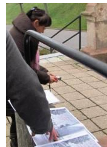
Podpora bariérové iniciativy ve spolupráci s Nadačí VIA