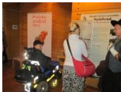
Finanční dar od festivalu Pražské znění