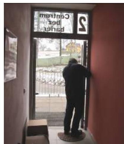
Nové otevírání dveří do Centra bez bariér od Nadace České pojišťovny