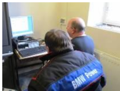
Nový systém vytápění od Nadace ČEZ