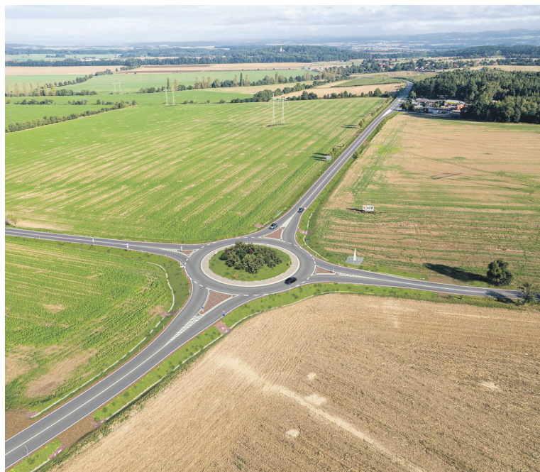
Budoucí podoba křižovatky U Voříšku.

V současné době probíhá výběrové řízení na zhotovitele stavebních prací, předpoklad pro zahájení stavebních prací je nejpozději v červnu letošního roku a potrvají minimálně přes celé léto. Stavbaři zde vybudují jednopruhovou okružní křižovatku se čtyřmi výjezdy a vnějším průměrem 46 metrů. Zpevněný