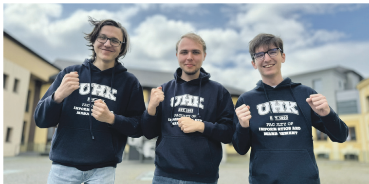
Úspěšní programátoři z hradecké univerzity.

V letošním ročníku vybrala odborná porota ze 14 úspěšných projektů osm finalistů, kteří po-