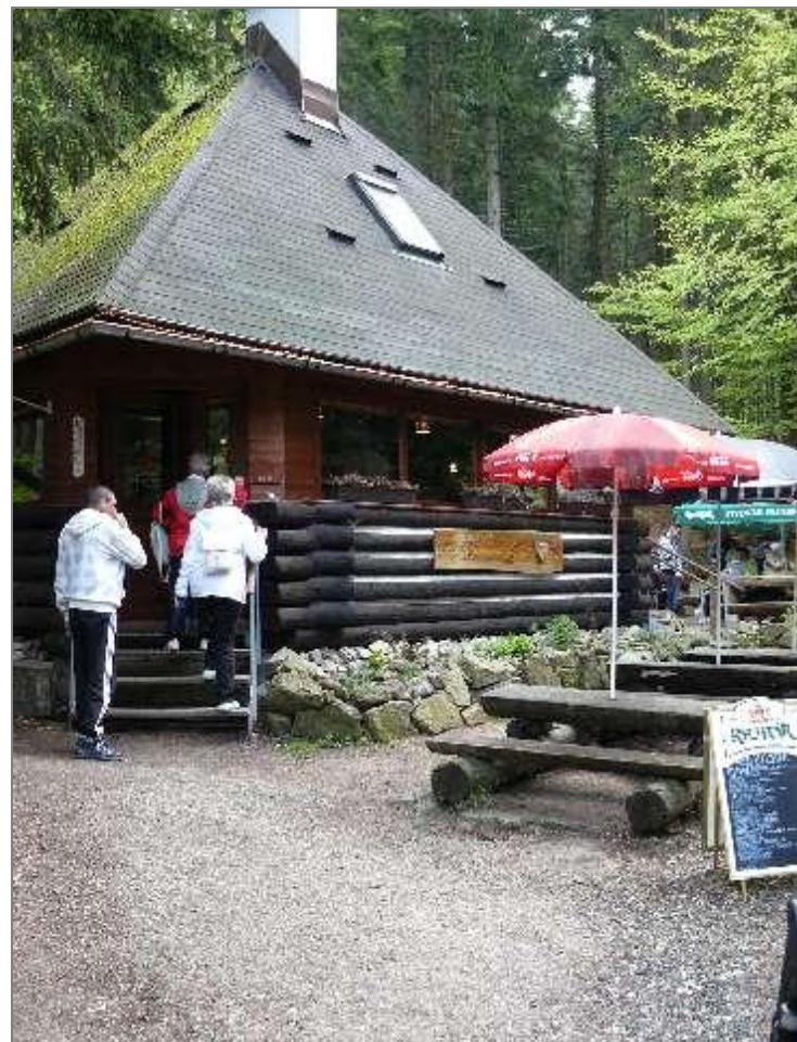
Foto – Srub U Lišáka Mumlava

Ovšem často by stačily pouze drobné úpravy spojené s minimálními náklady, jako jsou nájezdy, popřípadě přístupné zvonky pro přivolání asistence při vstupu do objektu.