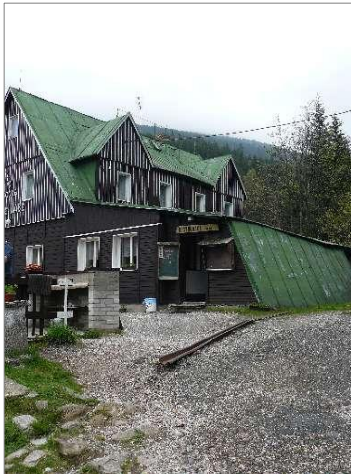
Foto Bouda u Bílého Labe