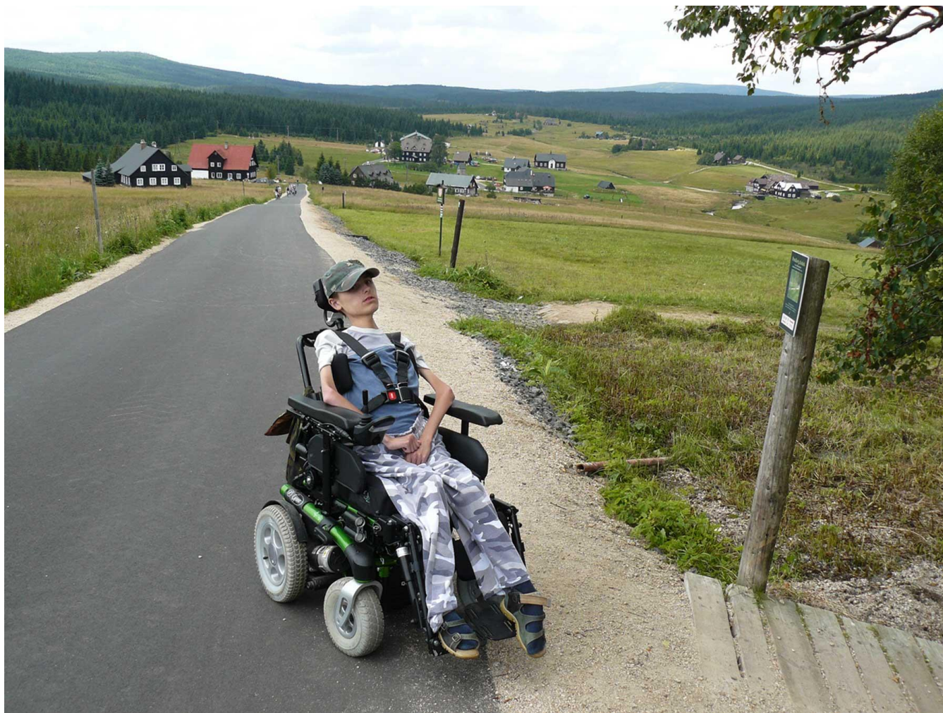
Výlet na Jizerku