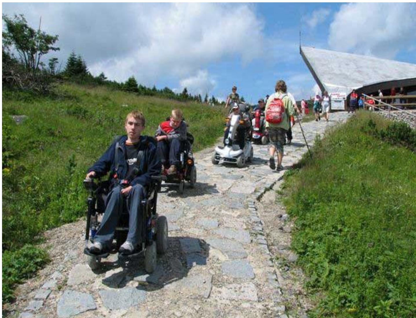
Výlet dětí z Parent Project - Labská Bouda