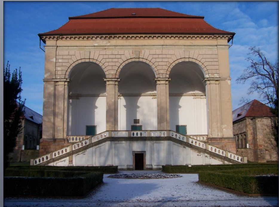
Pohled na letohrádek z Libosadu dnes

PERSPEKTIVNÍ POHLED NA VALDŠTEJNOVO CASINO (GRUND RIES VON DEM LUSTGARTNER GEBEÜTTE) V PLÁNU ZAHRADY U VALDICKÉ OBORY Z ARCHIVU SLAVNÉHO RODU TRAUTTMANNSDORF, AUTOR: JOSEPH THOMA, KOLEM ROKU 1790