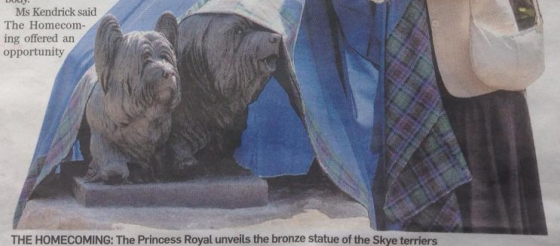
THE HOMECOMING: The Princess Royal unveils the bronze statue of the Skye terriers

Přes facebook došlo k seznámení s příznivci plemene Skye teriér nejen u nás v České republice, ale i v zahraničí. Cetus Bohemia Čoko má svůj domov u nás v Zrnku naděje a jak se mu u nás daří, sleduje mnoho lidí. Do světa se tak dostala i informace o činnosti Zrnka naděje ze Semil. Je moc fajn, že internet umožňuje i nám co neznáme jiné jazyky komunikovat díky překladateli. Máme tak možnost si psát i s přáteli z různých koutů světa..