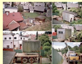
Také fotografie z rekonstrukce domu a zahrady Zrnka naděje