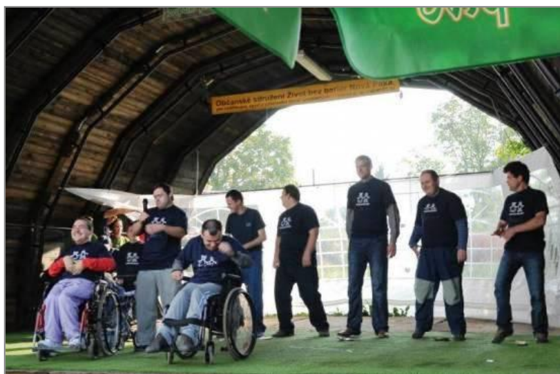
Festival Hraní bez hranic v centru občanského sdružení Život bez bariér – I. ročník 2011 za účasti 6 souborů zdravotně postižených klientů sociálních služeb z Královéhradeckého i Libereckého kraje