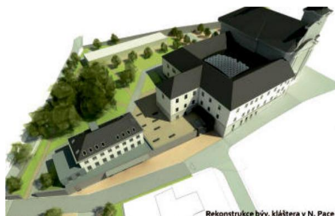
Rekonstrukce býv. kláštera v N. Pace

Život bez bariér v letošním roce připravuje projekty na rekonstrukci části klášterní budovy, která je v majetku organizace. V případě, že uspěje v dotačním řízení a získá finance ze strukturálních fondů (IROP – Integrovaný regionální operační program – Výzva č. 29 – Rozvoj sociálních služeb a výzva č. 38 – Rozvoj infrastruktury komunitních center), budou stavební práce zahájeny v příštím roce. Na konci projektu budou zrekonstruována tři podlaží a venkovní prostranství a nové prostory pro poskytování odborného sociálního poradenství, včetně poradenství pro osoby pečující o zdravotně postižené nebo seniory v domácnosti, denní stacionář pro lidi se zdra-