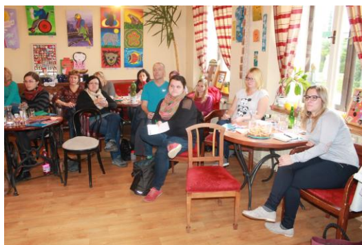
Autorka: Iva Laštovicová

Protože se sociální práce s klienty v jejich přirozeném prostředí neustále rozvíjí a také „více hlav, více ví“, uspořádala organizace PFERDA z.ú. historicky první workshop s tématem „Obtížné případy v rámci služby podpora samostatného bydlení“. Této akce se zúčastnilo kromě pracovníků organizace PFERDA z.ú. ještě dalších osm organizací z celé České republiky, od Ostravy po Prahu. Každá organizace přivezla jeden případ, který je z nějakého důvodu náročný na řešení, neví si s ním rady, nebo by ráda slyšela názory a nápady třetích stran. Ty mohou mít náhled „zvenčí“, ale také i podobné zkušenosti se zajímavým řešením. Kromě samotné práce s klienty si organizace mohly předat zkušenosti i z organizační stránky, nebo příklady dobré praxe a navázat nějakou dlouhodobější spolupráci.