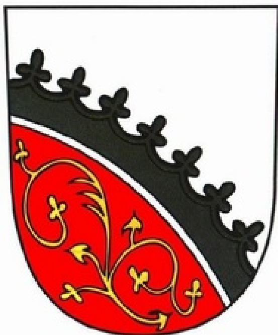
Město Nová Paka